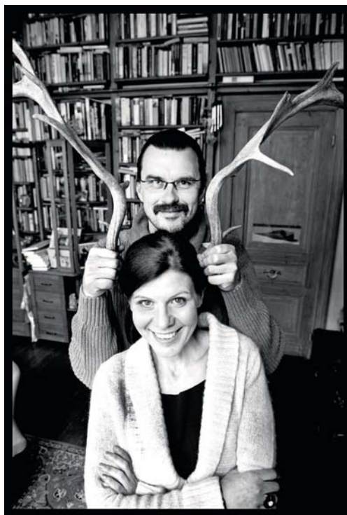
'Chomsky zei ons: vertrouw er niet op dat gekozenen het in jouw plaats zullen doen.'

Bij de vorige gemeenteraadsverkiezingen gaven jullie wel stemadvies. 'Stem niet op CD&V, SP.A of N-VA, want dat zijn BAM-partijen'. Niet iedereen in Antwerpen was daar zo blij mee: misschien heeft Patrick Janssens er zijn nederlaag zelfs aan te danken.